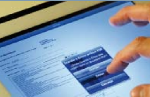
Los documentos quedan protegidos por el uso de contraseñas.

inicial podrán a disposición de sus colegas, a través de sus páginas web, la posibilidad de descarga de dicha aplicación. En un futuro, todos los agentes que legalmente pueden realizar anotaciones en el Libro de Incidencias electrónico podrán descargar dicha aplicación y realizar las mismas.